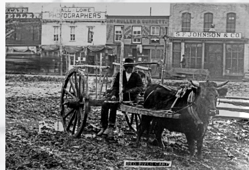
Charrette de la rivière Rouge